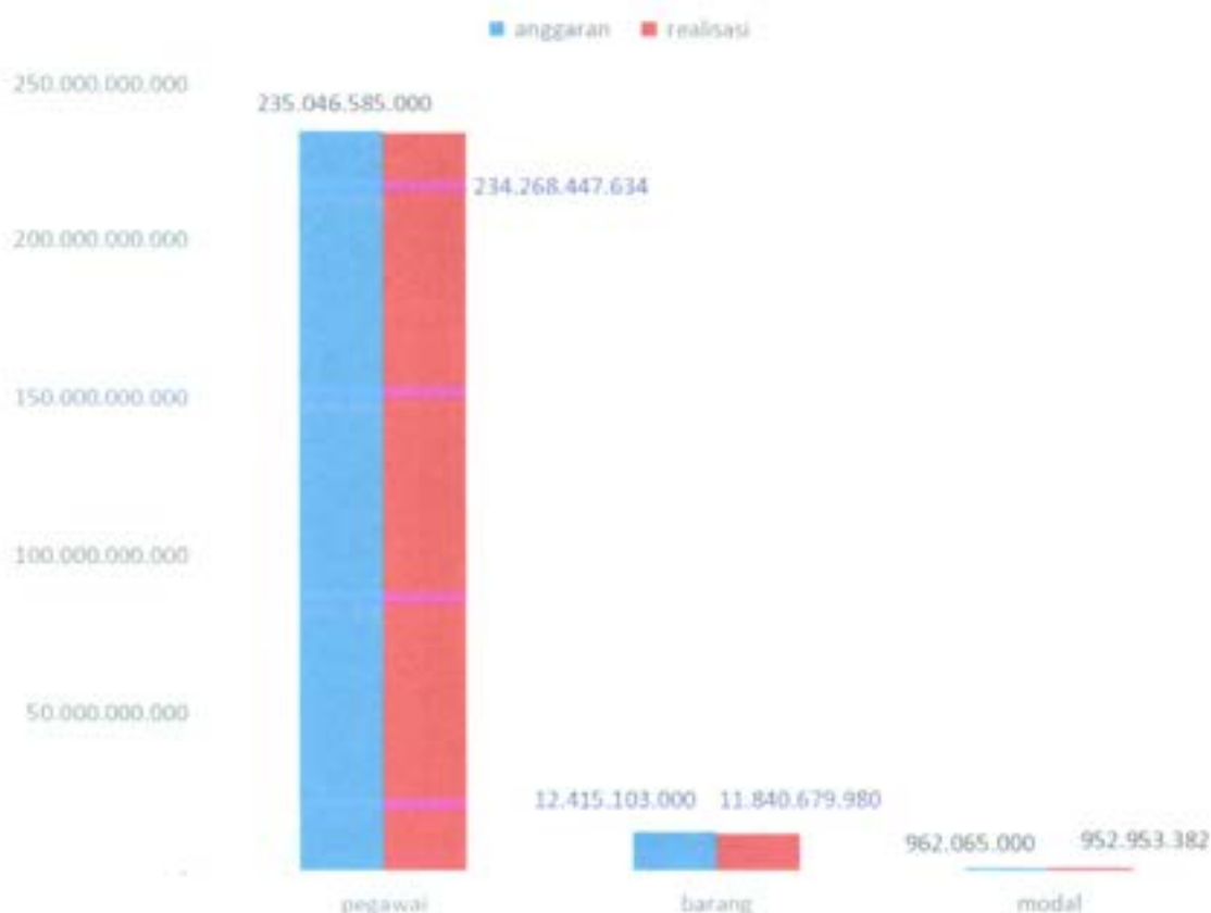
Grafik 1 Komposisi Anggaran dan Realisasi Belanja Tahun Anggaran 2021

Komposisi anggaran dan realisasi belanja tahun anggaran 2021, dapat dilihat dalam grafik berikut ini: